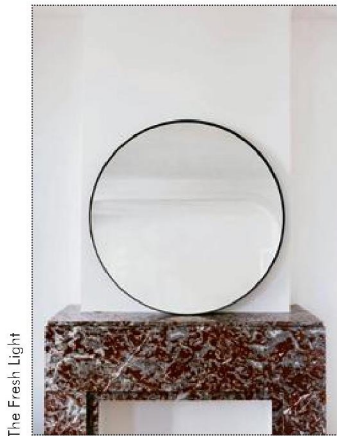
The Fresh Light